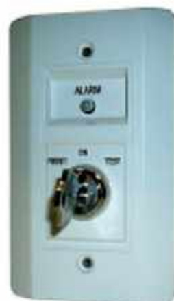
Рис. 1. Выносной пульт управления RTS451KEY

Выносной пульт управления RTS451KEY предназначен для контроля и дистанционного тестирования, линейных дымовых извещателей 6500R, 6500RS или 6424 и извещателей серий DN400 устанавливаемых в воздуховодах. На передней панели выносного пульта управления расположен двухцветный светодиодный индикатор зеленого и красного цвета и устройство запуска теста. Зеленый цвет светодиода предназначен для индикации напряжения питания извещателя, а красный цвет для индикации режима "Пожар". Устройство запуска теста имеет с фиксацией две позиции "ON" и "TEST" и одну без фиксации позиции (с самовозвратом) "RESET".